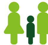
GENITORI CON FIGLI PIÙ GRANDI